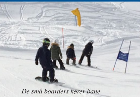
De små boarders kører bane

Der er både korte klubture på 3–5 dage og klubture, der strækker sig over 7–9 dage.